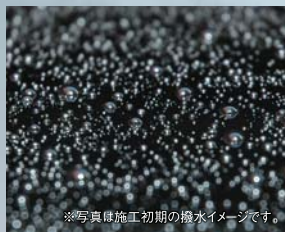
※写真は施工初期の撥水イメージです。

「ガードコスメSP」は、有効成分の含有率を高めたガラス質被膜を形成。 その被膜が高級感のある輝きと光沢、そして高い撥水性を実現しています。