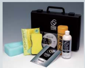
専用メンテナンスキット

普段のお手入れは水洗いでOK。水洗いで落ちない汚れが付着したり、水弾き(撥水効果)が低下した場合は、付属のメンテナンスクリーナーをご使用ください。